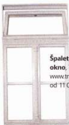
Špaletové okno , Trustav, www.trustav.cz , od 11 000 Kč/m 2