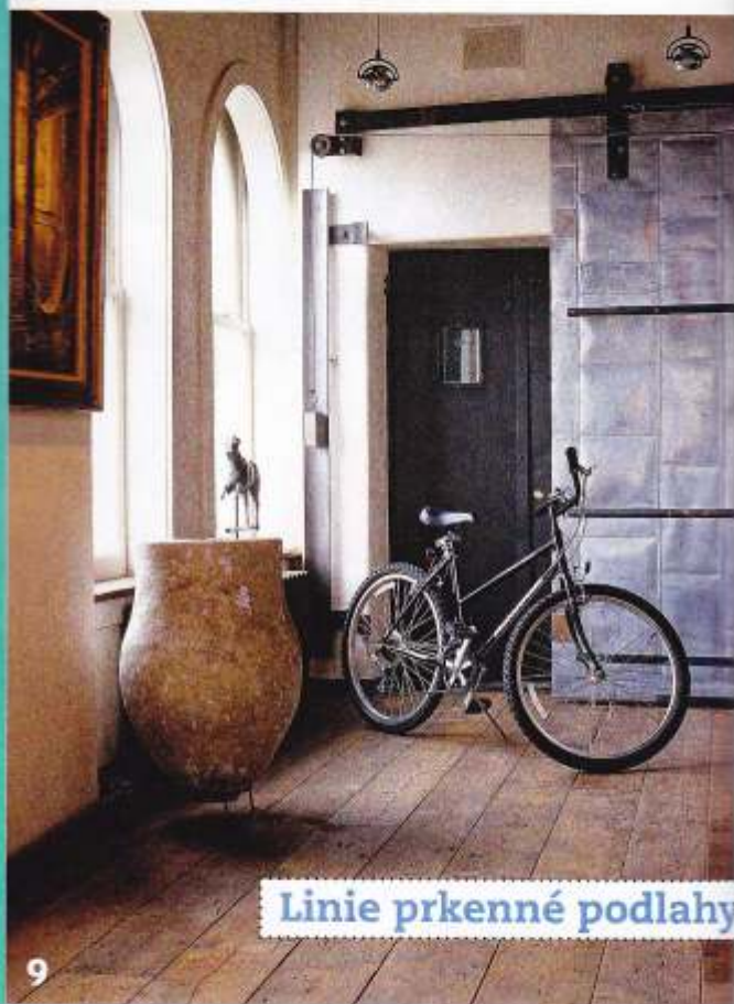
Linie prkenné podlahy

Pokud máte dřevěné parkety či palubovou prkennou podlahu, rozhodně je neschovávejte pod kobercem, není-li to z nějakého důvodu nutné. Pokud je taková podlahy ve špatném stavu, většinou je možnost ji opravit. Záleží jen na stupni poškození. Jestli je pouze ohozená a je zašlý lak, stačí ji přebrousit bruskou na podlahy, nalakovat, navoskovat či napustit olejem, a podlaha bude jako nová. Cena za kompletní službu se pohybuje přibližně kolem 300 Kč/m 2 . Výhodou je, že to můžete mnohokrát opakovat. Jestliže máte historickou dlažbu, existují také prostředky pro její očištění a impregnaci. Pokud je nutné udělat novou pokládku podlahy, snažte se investovat do nejlepších výrobků na trhu, rozhodně se vám to vyplatí.