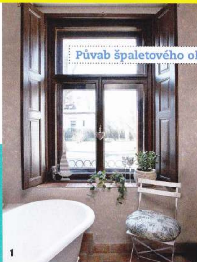
Půvab špaletového okna