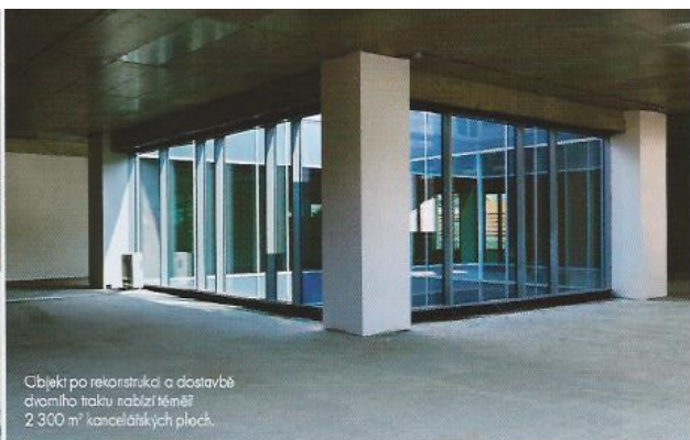
Objekt po rekonstrukci a dostavbě druhého patra nabízí téměř 2 300 m 2 kancelářských ploch.