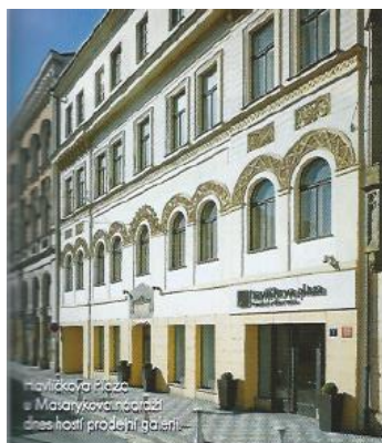
našláková Praha ■ Masarykovou odíždí dnes hostí prodejně galérie