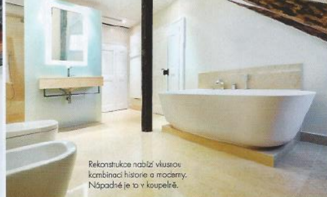
Rekonstrukce nabízí vstusnou kombinaci historie a moderny. Nápadné je to v koupelně.

Dva činžovní domy na Malé Straně z r. 1708 se nadacily se novému životu.